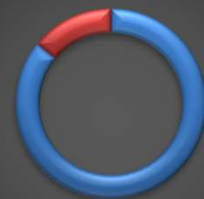
Részterületenkénti CO 2 kibocsátás, 2022

■ Épületek / Building ■ Szolgáltatás / Production